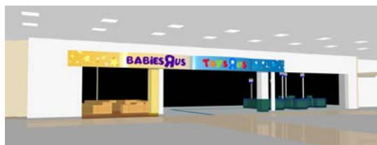
『トイザラス ベビーザラス 鹿児島店』外観 <イメージ>