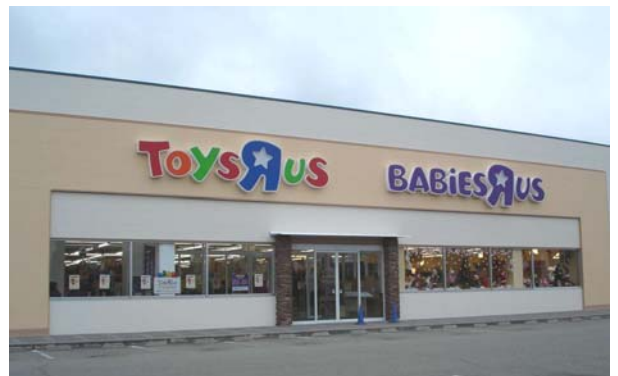
「トイザラス ベビーザラス 加古川店」外観

『サイド バイ サイド ストア』は、対象年齢の異なる「トイザラス」と「ベビーザラス」の併設により、ご家族の年齢構成に応じて両店舗を同時にご利用いただくことや、お子様の成長にあわせて利用店舗を移行していただくことができ、お客様にとって、より利便性の高い店舗となります。また、レジやサービスカウンター、倉庫などを共通利用することで、より効率的で収益性の高い店舗運営が可能となります。さらに、小型の「ベビーザラス」を「トイザラス」と併設して出店することにより、「ベビーザラス」単独店舗の出店条件には満たない中小規模商圏への出店も可能となるため、「ベビーザラス」の店舗網のより一層の拡大を図ることができます。