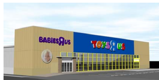
『トイザラス ベビーザラス 伊勢崎店』外観 <イメージ>