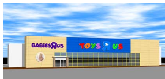
『トイザラス ベビーザラス 丸亀店』外観 <イメージ>